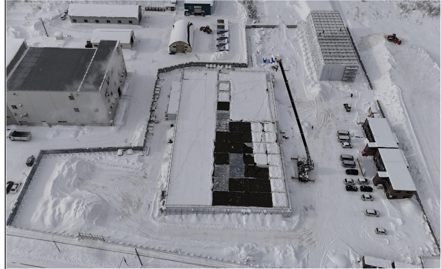
撮影箇所：①東面上空