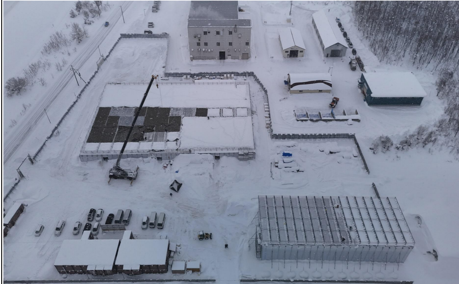
撮影箇所：④北面上空