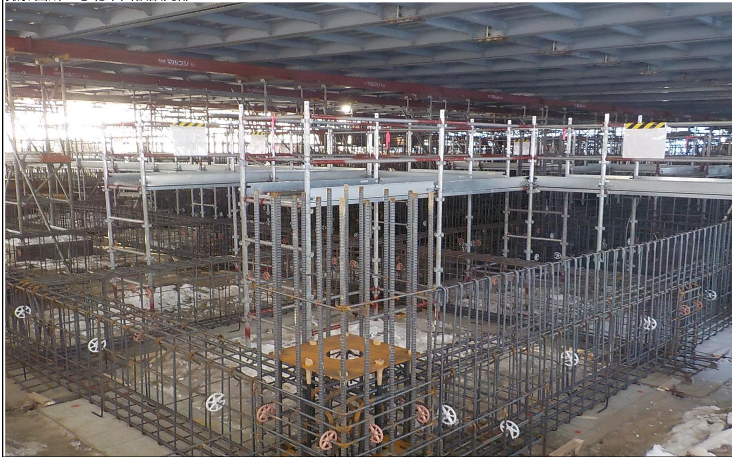
撮影箇所：⑧北西面仮設内部