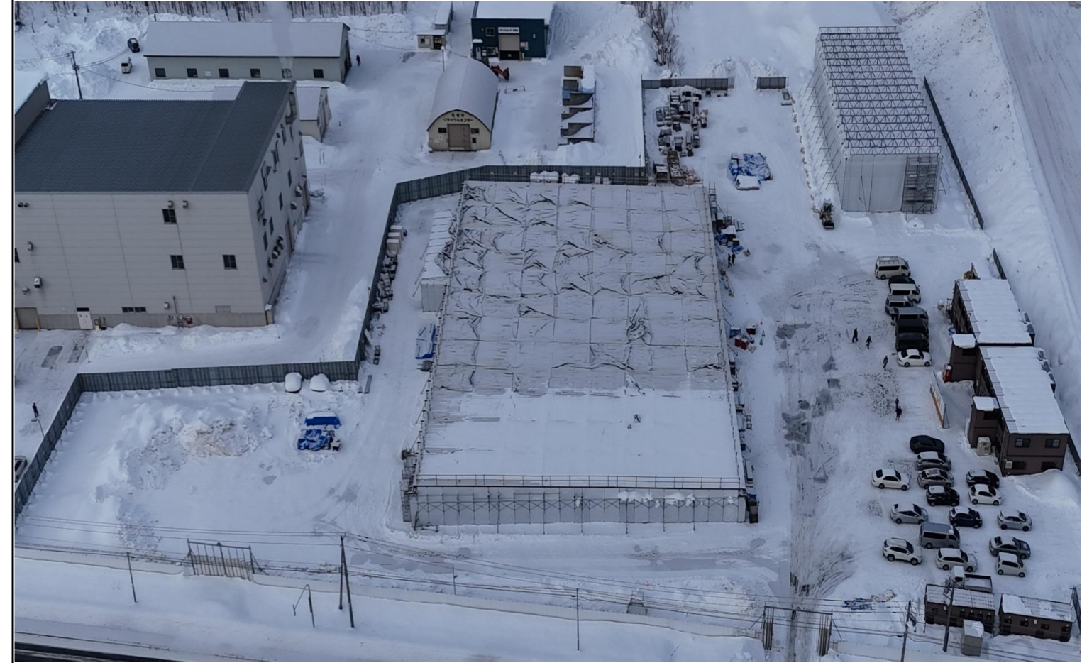
撮影箇所：①東面上空