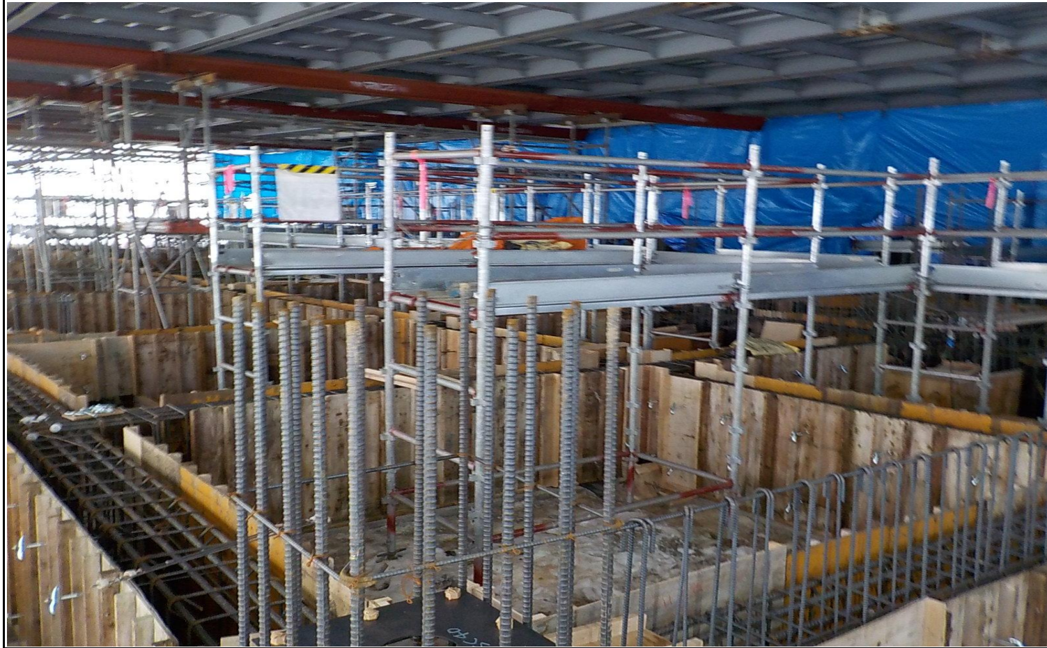
撮影箇所：⑧北西面仮設内部