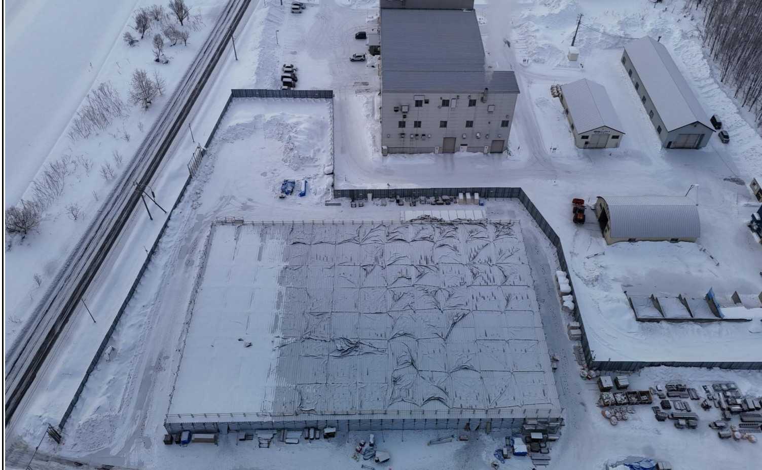
撮影箇所：④北面上空