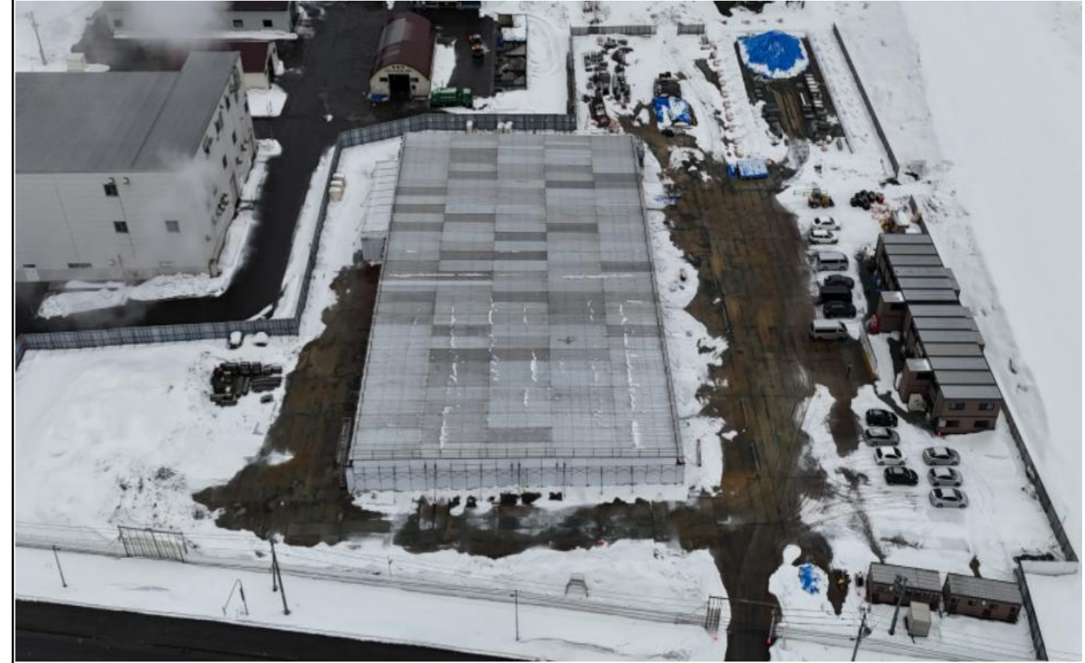
撮影箇所：①東面上空