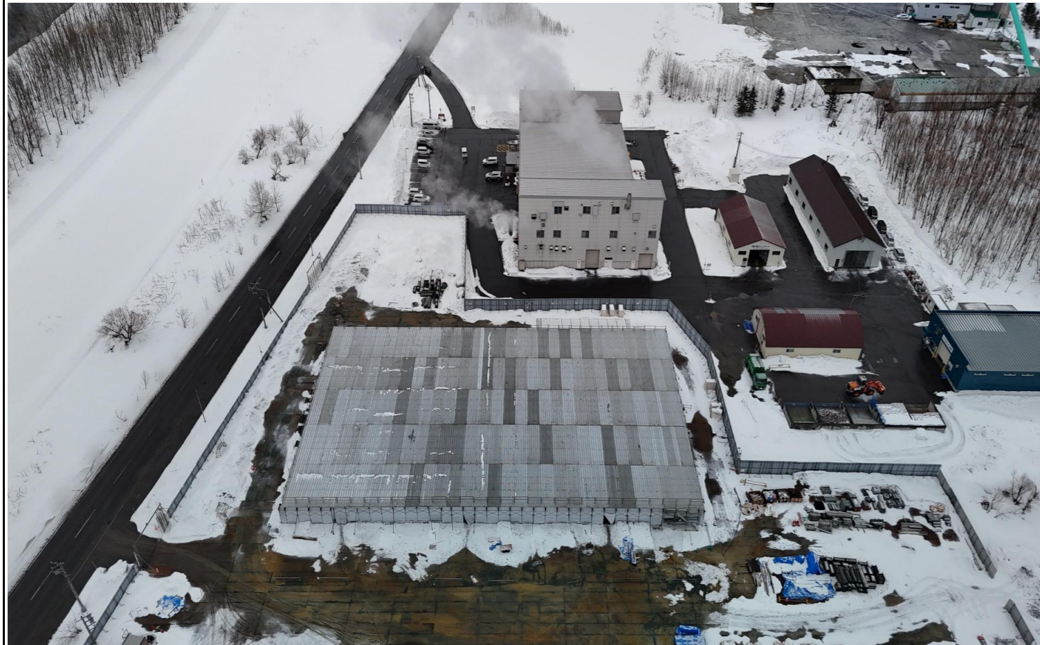
撮影箇所：④北面上空