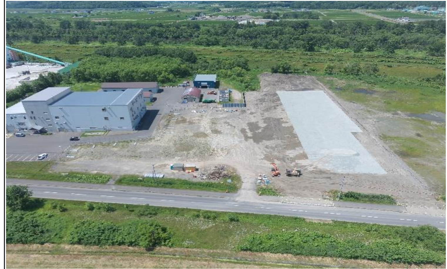
撮影箇所：①東面上空