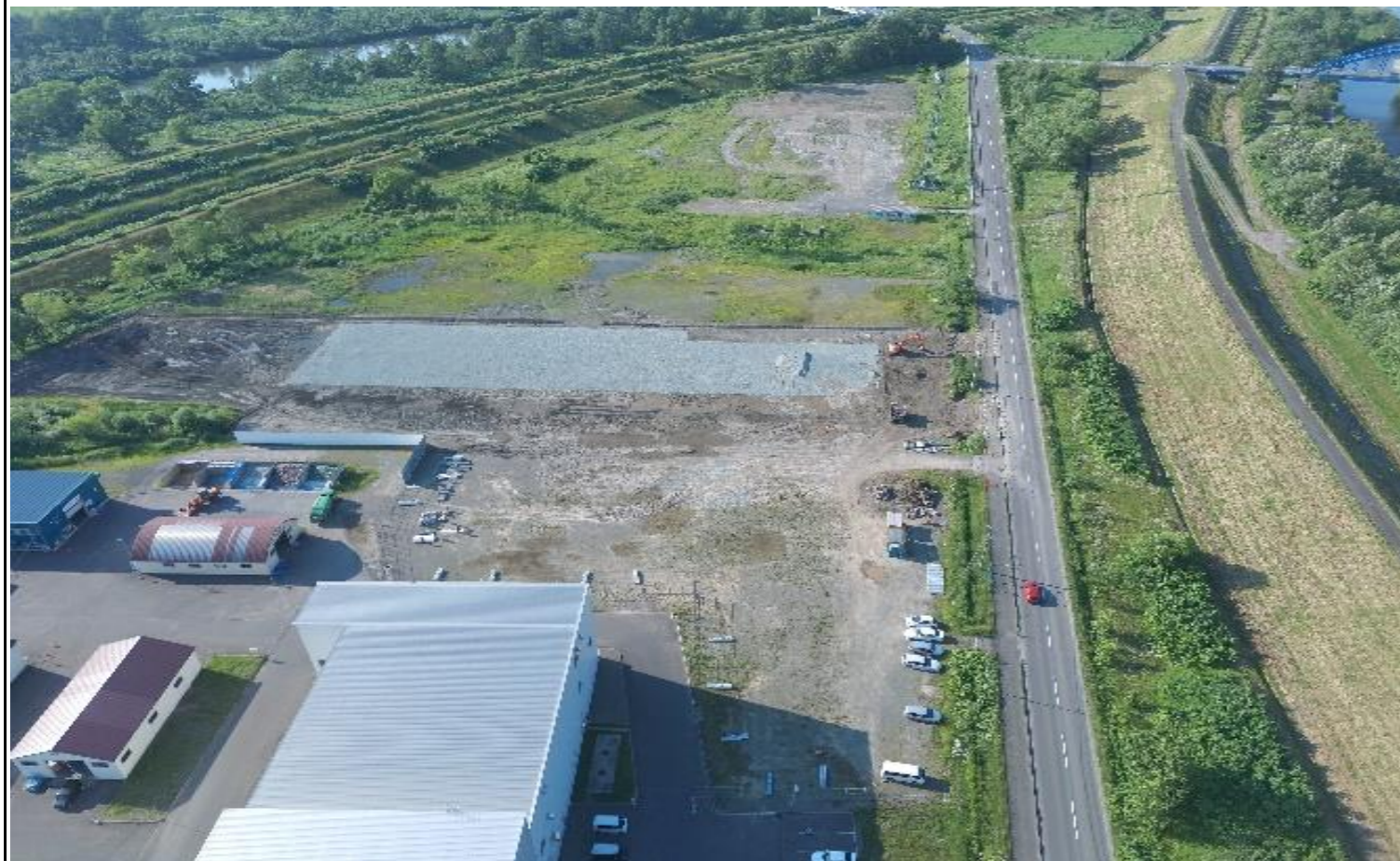
撮影箇所：④北面上空