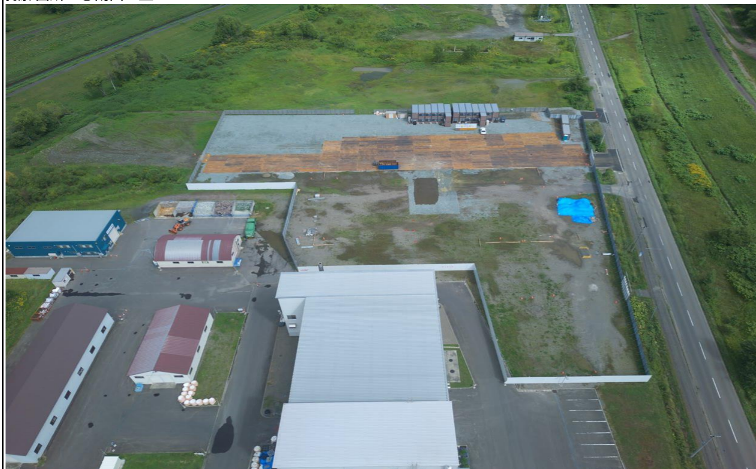
撮影箇所：④北面上空