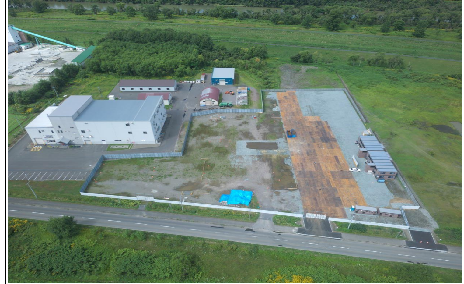
撮影箇所：①東面上空