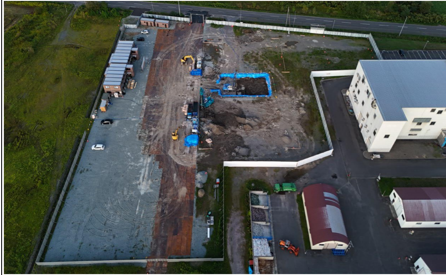
撮影箇所：②西面上空