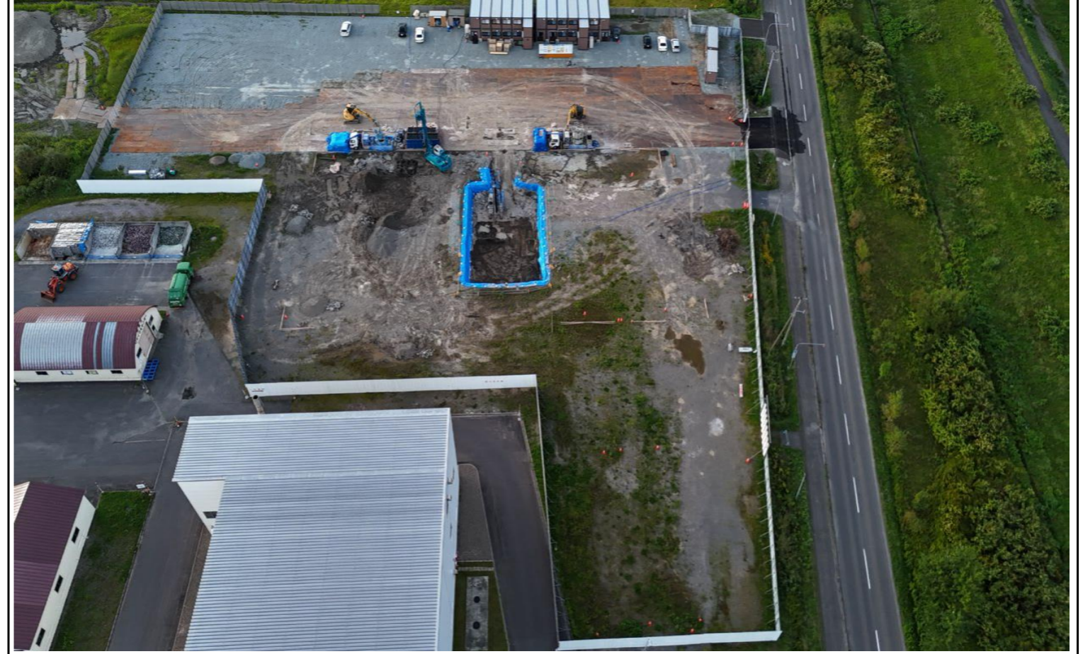
撮影箇所：③南面上空