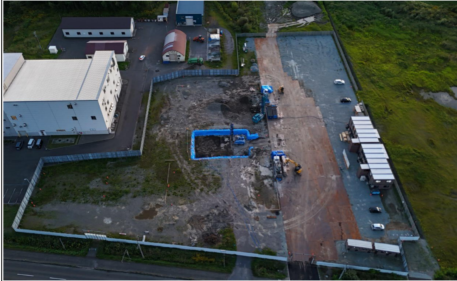
撮影箇所：①東面上空