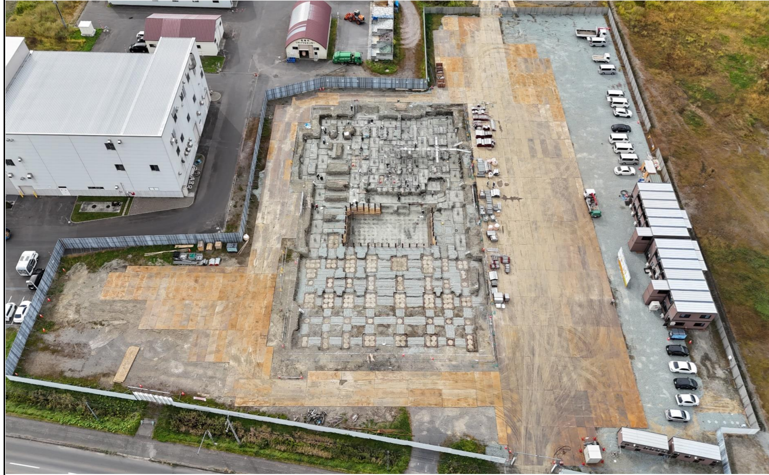
撮影箇所：①東面上空