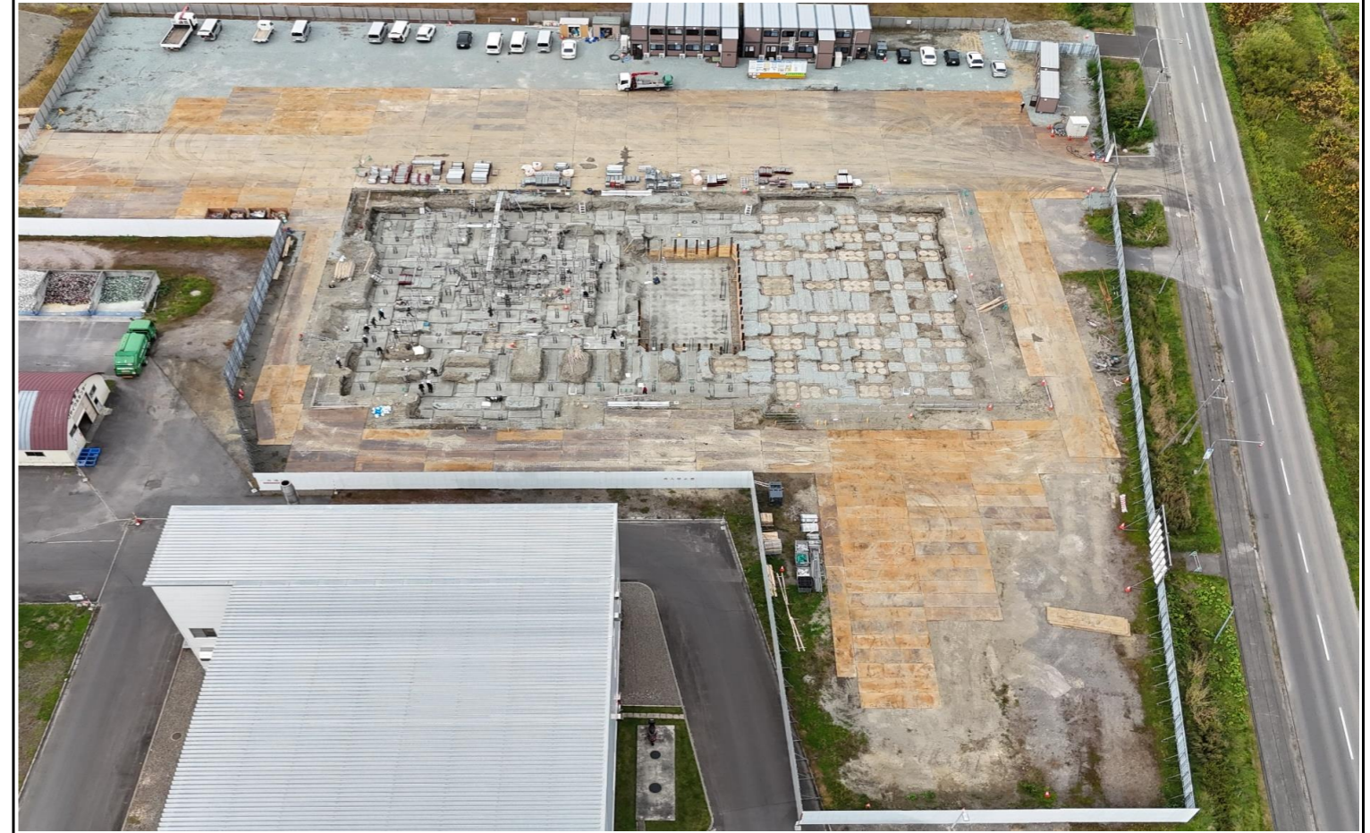
撮影箇所：③南面上空