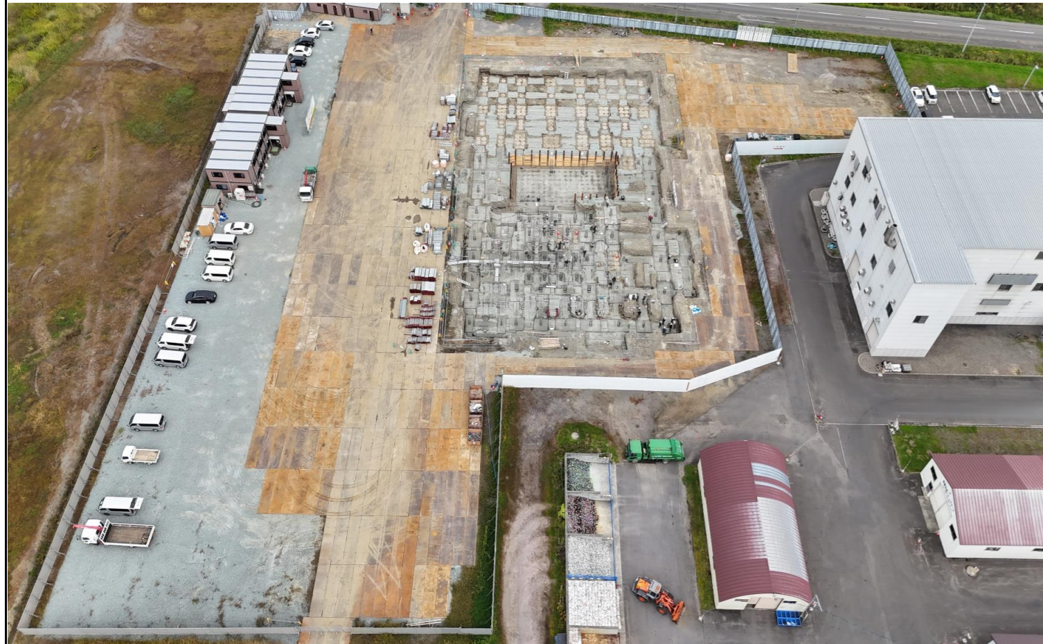
撮影箇所：②西面上空