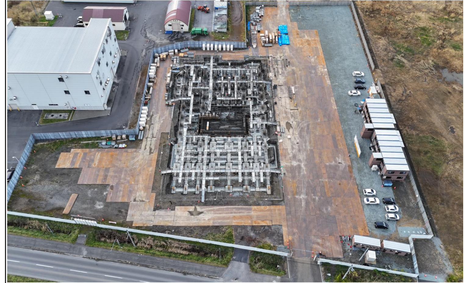
撮影箇所：①東面上空