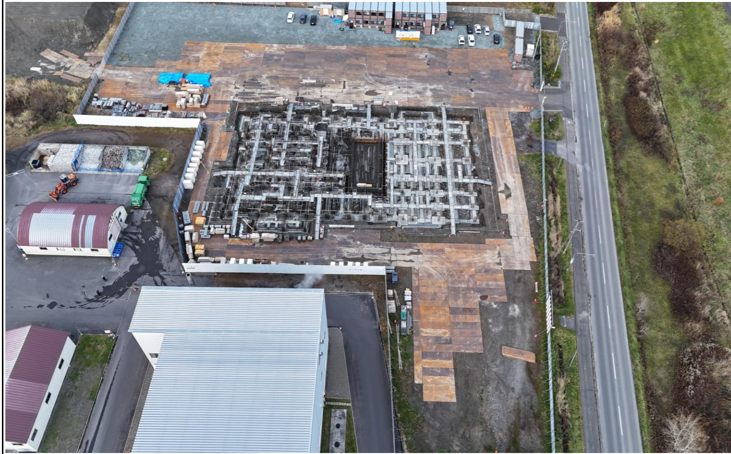
撮影箇所：④北面上空