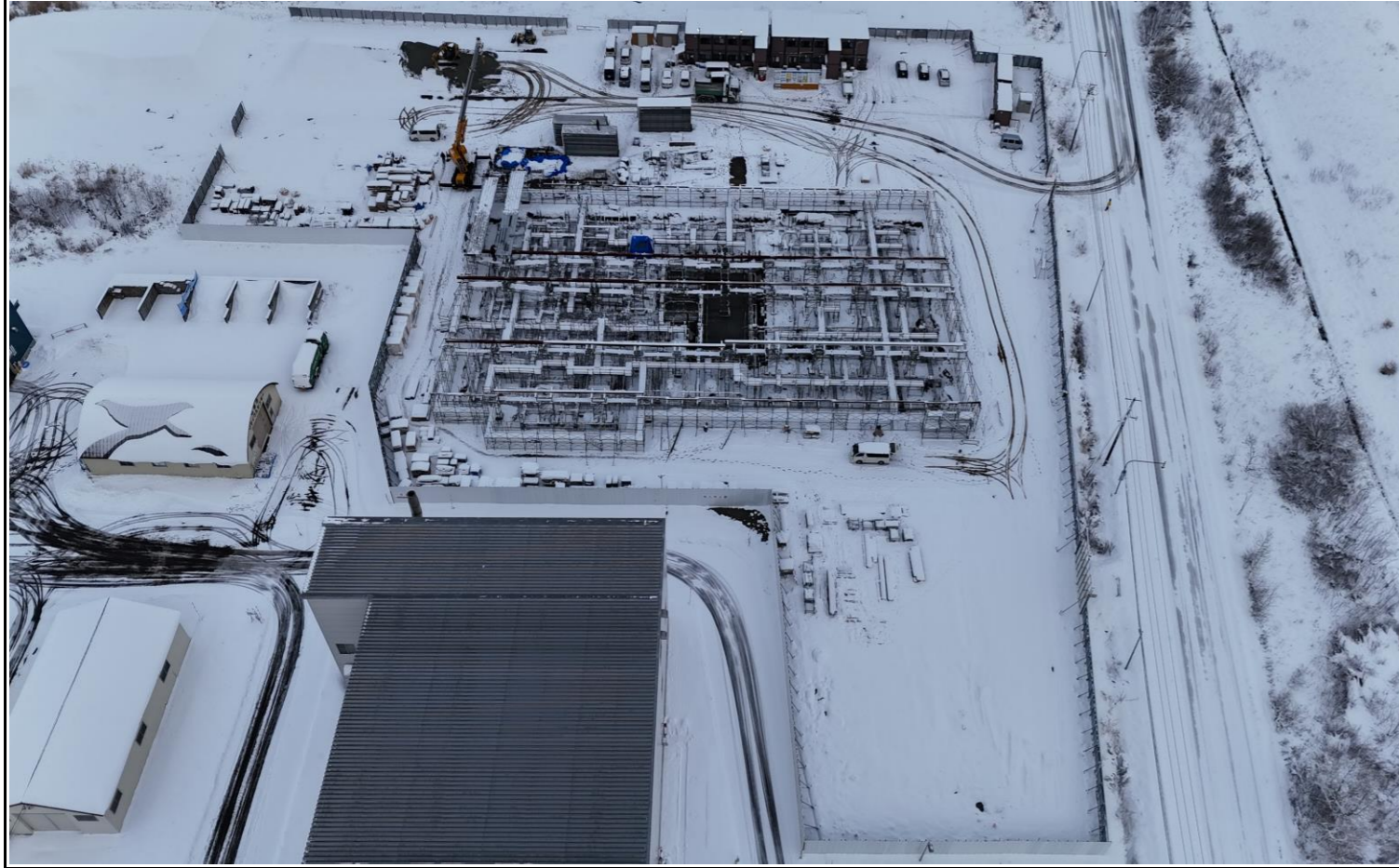
撮影箇所：④北面上空