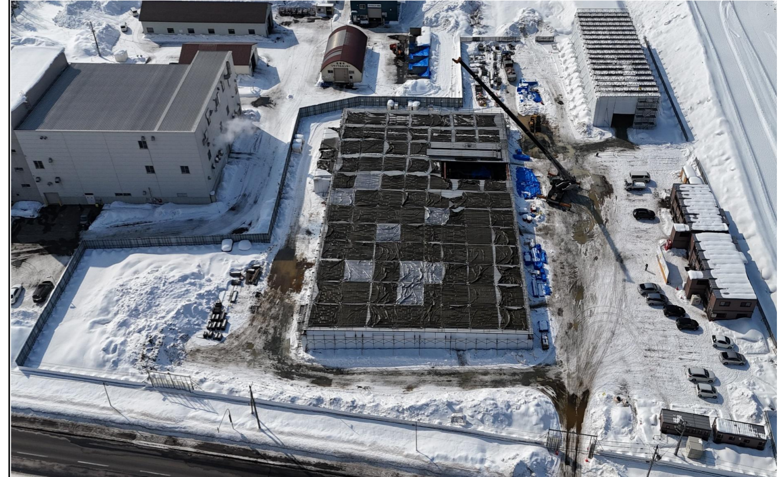
撮影箇所：①東面上空