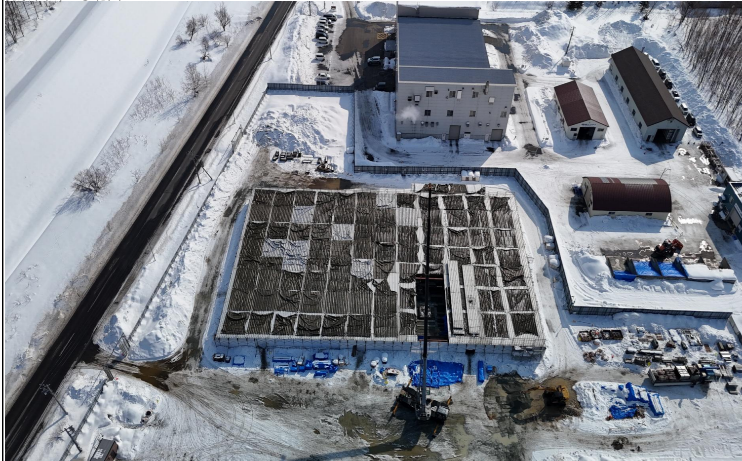
撮影箇所：④北面上空