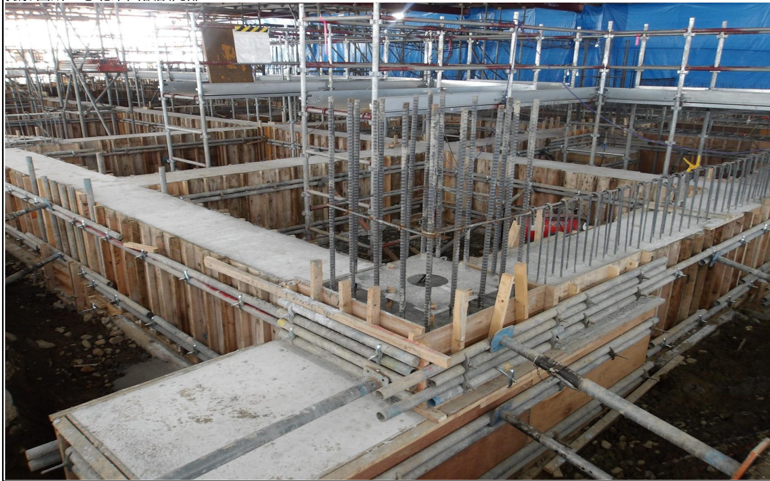
撮影箇所：⑧北西面仮設内部