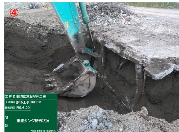
地下重油タンク撤去状況