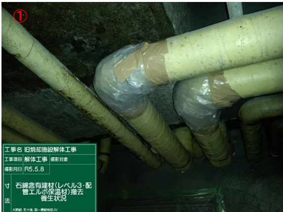
① 配管エルボ切断前 養生状況