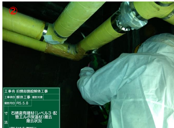
② 配管エルボ撤去状況 (直管部分にて切断)