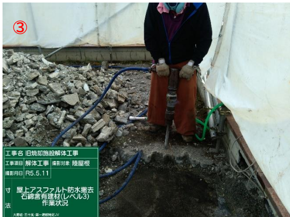
③ 屋上アスファルト防水 撤去状況