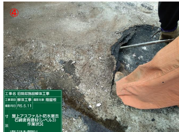
④ 屋上アスファルト防水 撤去状況