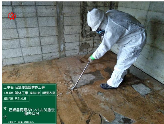
工事名 旧焼却施設解体工事 工事項目 解体工事 撮影対象 1階更衣室 撮影月日 R5.4.6 寸法 石棉含有建材(レベル3)撤去状況 大野建 五十嵐 第一建設株式会社