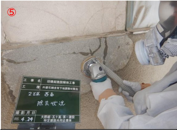
外壁アスベスト除去作業状況