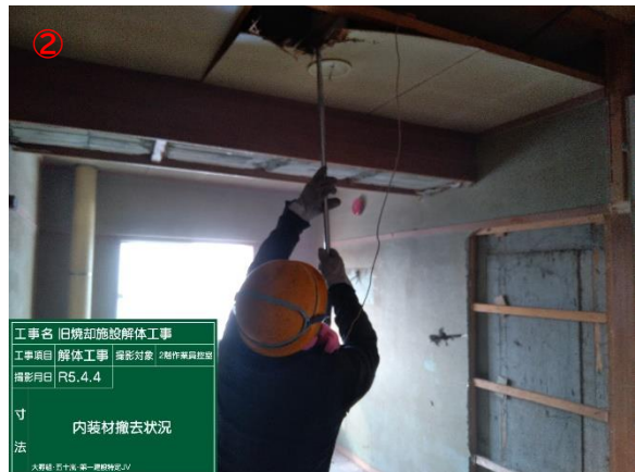
工事名 旧焼却施設解体工事 工事項目 解体工事 撮影対象 2階作業員社室 撮影月日 R5.4.4 寸法 内装材撤去状況 大野建 五十嵐 第一建設株式会社