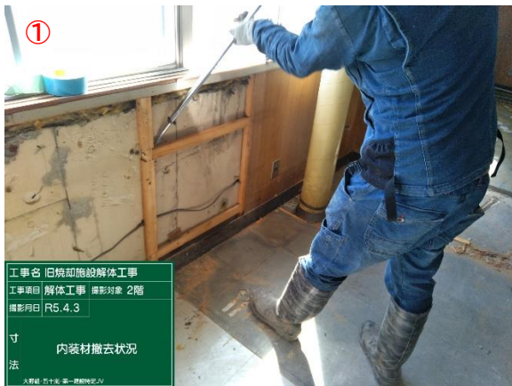
工事名 旧焼却施設解体工事 工事項目 解体工事 撮影対象 2階 撮影月日 R5.4.3 寸法 内装材撤去状況 大野建 五十嵐 第一建設株式会社

○事務所等の内装材の解体撤去作業を行いました。 ○建屋の外壁（北面・西面）のアスベスト除去作業を行いました。 (進捗率 70%)