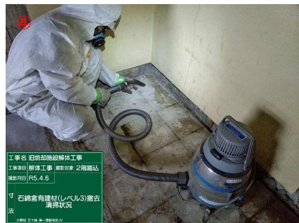
工事名 旧焼却施設解体工事 工事項目 解体工事 撮影対象 2階廊下 撮影月日 R5.4.6 寸法 石棉含有建材(レベル3)撤去清掃状況 大野建 五十嵐 第一建設株式会社