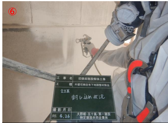
外壁アスベスト除去後 封じ込め作業