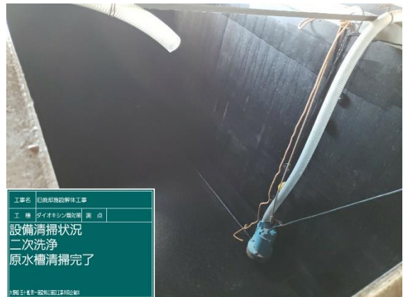
洗浄循環水槽内清掃作業（洗浄後）