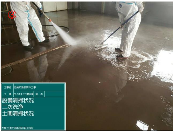
③ 炉室内ダイオキシン類洗浄作業（作業中）