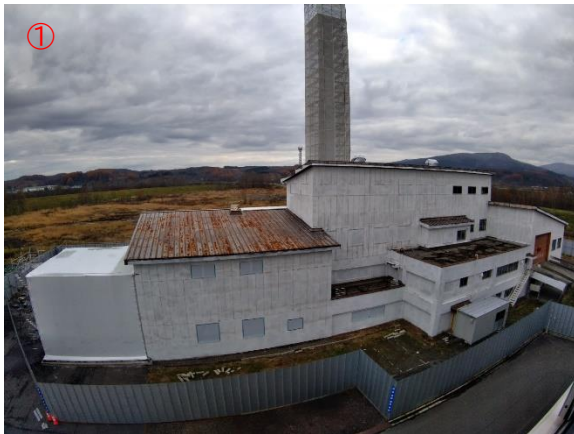
① アスベスト除去面（南東）の養生足場撤去