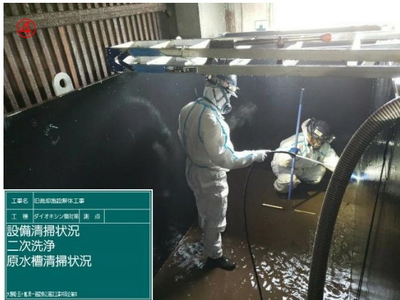
洗浄循環水槽内清掃作業（作業中）