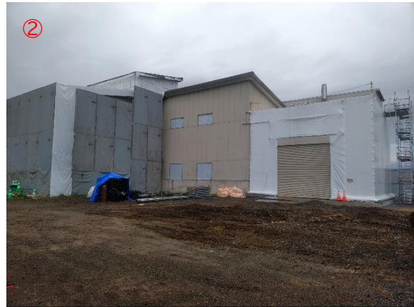
② アスベスト除去未施工面（北西） ※来春施工予定