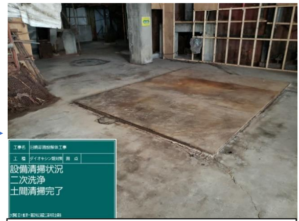
④ 炉室内ダイオキシン類洗浄作業（洗浄後）