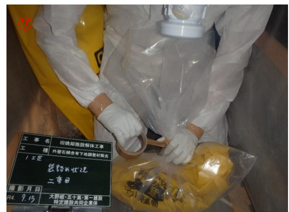
アスベスト粉 袋詰め作業