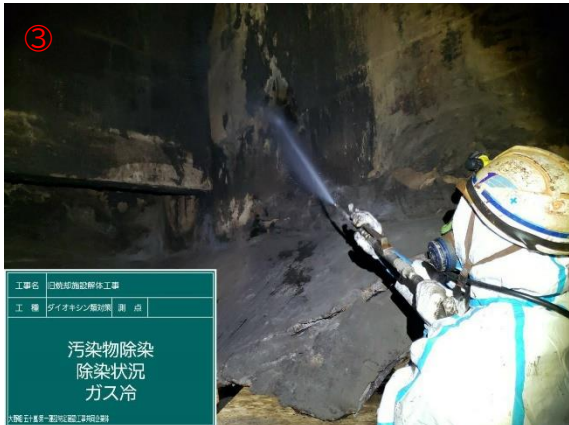
炉室内ダイオキシン類洗浄作業（作業中）