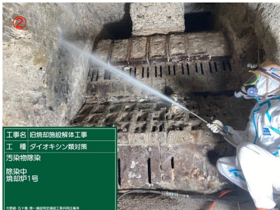
炉室内ダイオキシン類洗浄作業（作業中）