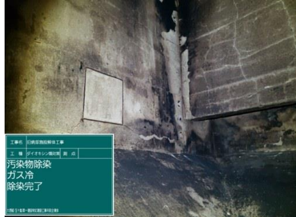
炉室内ダイオキシン類洗浄作業（洗浄後）