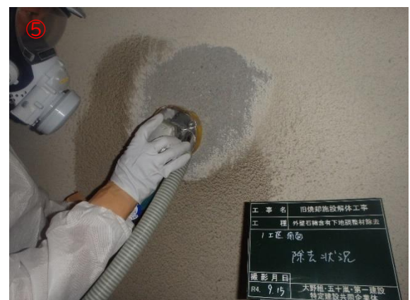
アスベスト除去作業