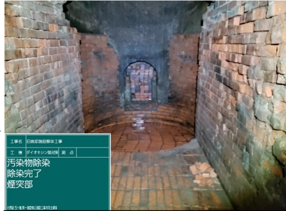
煙突内ダイオキシン類洗浄作業（洗浄後）