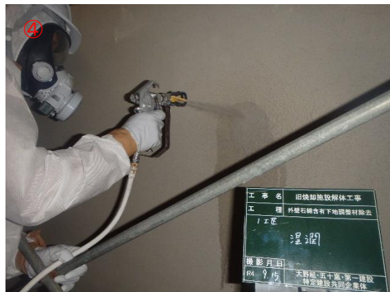
アスベスト除去前 飛散防止湿润化