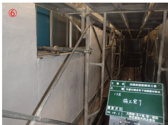
アスベスト除去作業完了