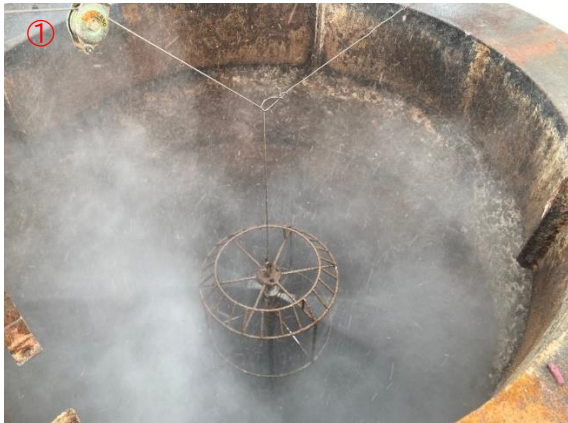
煙突内ダイオキシン類洗浄作業（作業中）