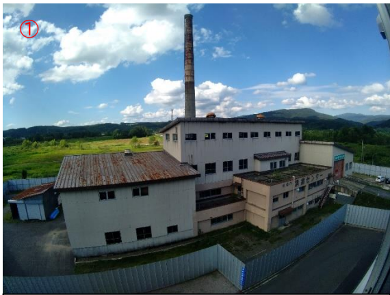
南面全景写真 (仮囲い完了後)

○対象施設の仮囲いが完了しました。8月からはダイオキシン類の除染作業に向けて、土壌への浸透防止用土間コンクリートの打設・建屋の密閉化を予定しております。 (進捗率 0.1%)