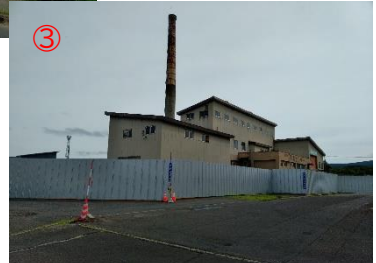
敷地仮囲い状況写真